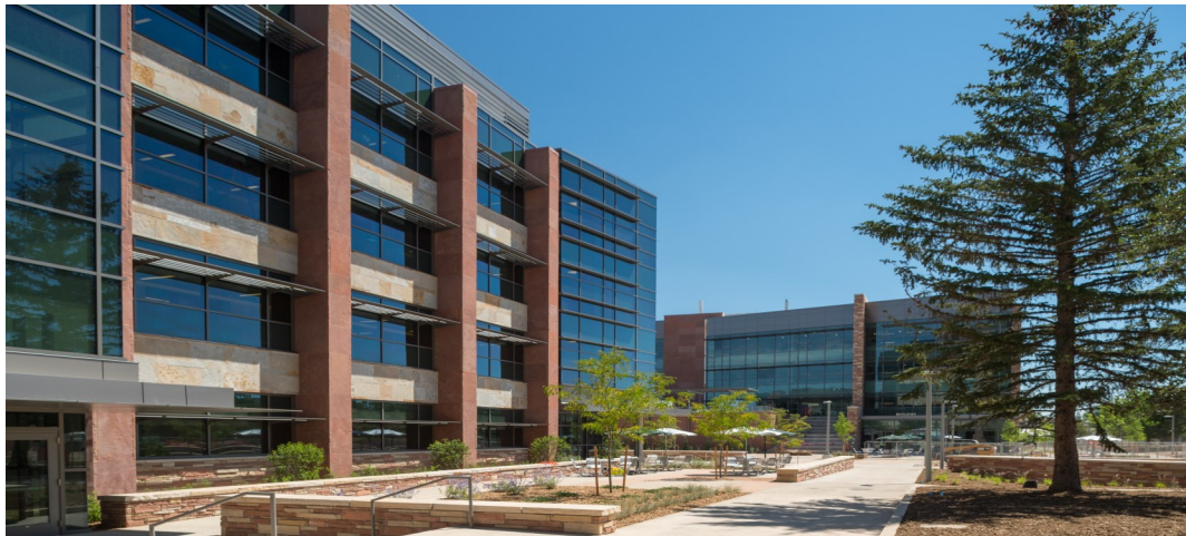
Nuevos edificios de investigación y biología– completados en verano del 2017

En Agosto se terminó de construir el edificio de biología, el edificio de química, el estadio, el paso subterráneo Shields/Elizabeth y el centro de Salud y Médico. La construcción está en marcha para la siguiente ronda de proyectos incluyendo la adición al edificio de recursos naturales Michael Smith, el instituto de medicina translacional CW McIlwraith, el centro de acercamiento de educación de la salud, el centro de innovación de comida global JBS y el centro de diseño Richardson. La construcción empezará en el Corbett Parmelee Dining Hall y en Lobby Renovation en la primavera del 2018.