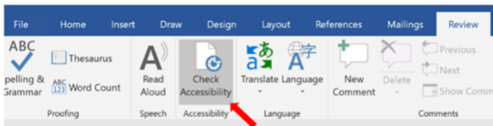
Example 1: Microsoft Office 2019

No tiene que realizar mejoras físicas al campus para hacer que la accesibilidad y la inclusión sean parte de sus labores diarias. Hay pequeñas cosas que todos podemos hacer para hacer una diferencia en la comunidad de CSU. Al liderar y participar en reuniones en línea, una práctica fácil es seguir estas simples recomendaciones de inclusión . Al trabajar en Microsoft Word o Excel, podemos revisar rápidamente la herramienta “Check Accessibility”. Si no conoce esta herramienta, para aquellos que tienen Microsoft Office 2019, está ubicada bajo la pestaña de “Review”. Para aquellos que tienen Microsoft Office 2016 Professional Plus, está ubicada bajo la pestaña “File” bajo “Info” y luego “Check for Issues.” Con el reciente 30 Aniversario, en julio, de la aprobación de la Ley Estadounidense para Personas con Discapacidades (A.D.A), hay otra cosa que puede hacer. Si quiere más información sobre los impactos positivos de A.D.A. y por qué es importante, el Equipo de Diversidad recomienda escuchar el episodio A.D.A. Now de una hora de duración, del podcast Throughline , de la Radiodifusora Nacional Pública (NPR, por sus siglas en inglés). O, si prefiere leer, esta serie de artículos del New York Times explora el tema de la ley A.D.A. y la vida con una discapacidad. (NYTimes.com es gratuito para todos los empleados de CSU – puede acceder a su suscripción aquí .)